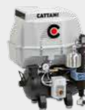
Protezione insonorizzante in plastica -10 dB(A) ca. Noise-reducing plastic cover - approx. 10 dB (A)

HIGH QUALITY AND PURITY DRY COMPRESSED AIR.