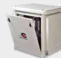
Carenatura insonorizzante -20 dB(A) ca. Soundproof cabinet - approx. 20 dB (A)

I modelli AC100 - AC200 - AC300 possono essere insonorizzati sia con le protezioni in plastica che con le carenature. I modelli AC400 e AC600 possono essere insonorizzati solo con le protezioni in plastica. Con i modelli AC1800 e oltre è necessario insonorizzare l'ambiente.